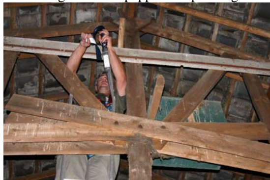
6 ...en gebruik de haak van het valstopapparaat om jezelf te zekeren.