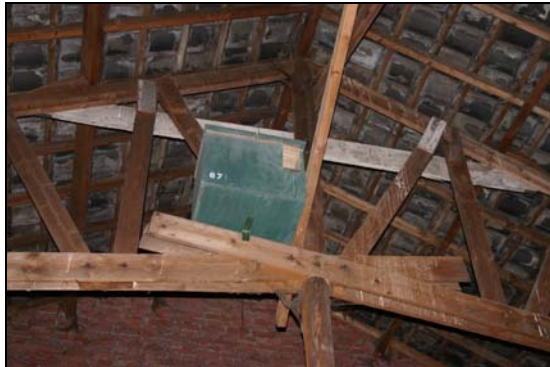
1. Gebruik de valbeveiliging altijd bij kasten die hoger hangen dan 3 meter.