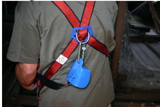
4 Bevestig het valstopapparaat op de rug.