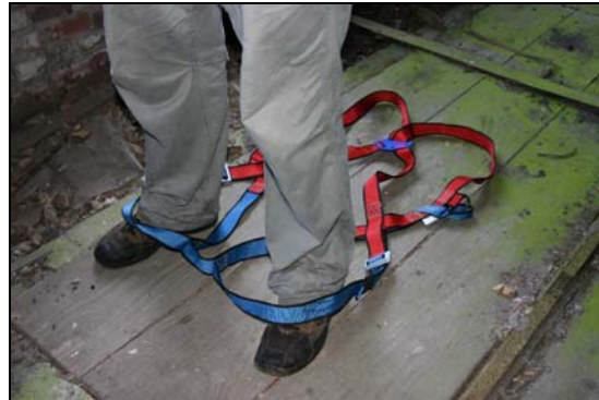
2. De eerste stap bestaat uit het aantrekken van het veiligheidsharnas.