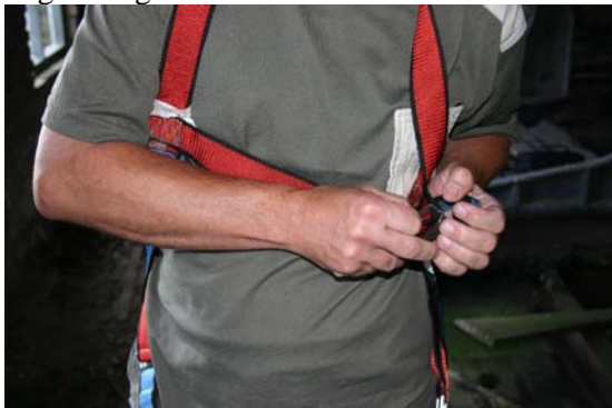
3. Maak met de gesp de lussen vast.