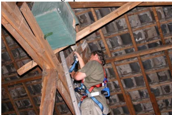
5. Klim vervolgens de ladder op...