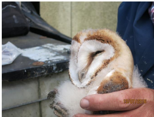
Juveniel vasthouden voor het ringen.

EN natuurlijk genieten van al onze activiteiten ter bescherming van de kerkuil.