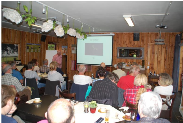
De kerkuilen presentatie.