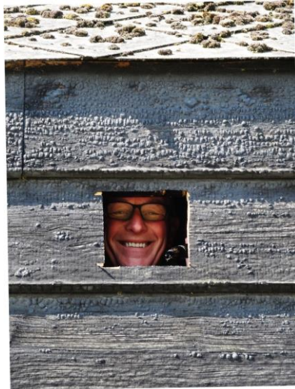
Opening gemaakt voor plaatsen van in- uitlooppijp.